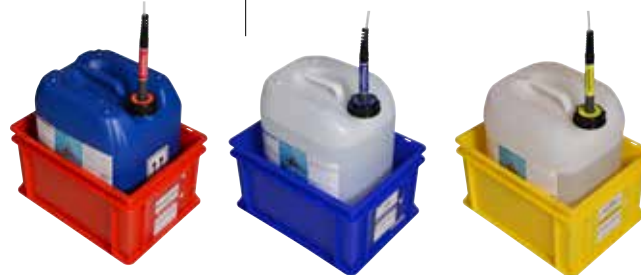
Sicherheits-Lagerbehälter mit Farbcodierung